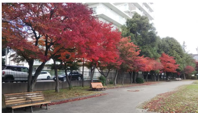
新寺4丁目公園 仙台市若林区新寺4丁目