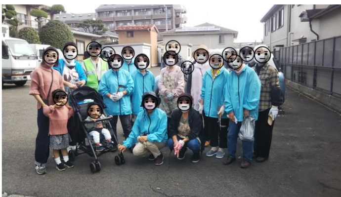
連坊中部町内会「草取り隊」