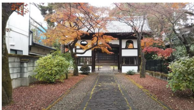
正楽寺 仙台市若林区新寺2丁目6-35