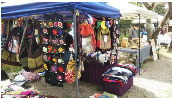
新寺小路緑地 仙台市若林区新寺2丁目8